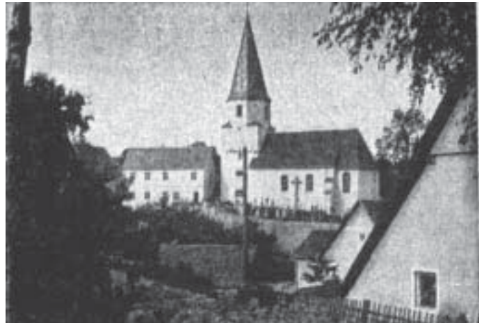
Blick auf das Dorf Laaber, Landkreis Neumarkt Opf.

Freundlich in einer Talmulde, etwa 2 Stunden östlich von Neumarkt, liegt das Dörfchen Laaber, das seinen Namen mit dem dort entspringenden Fluß der Schwarzen Laaber teilt. Anmutig schmiegen sich die Häuser, die so recht an fränkische Bauart erinnern, um die Dorfkirche. – Meine heutigen Zeilen mögen mit kurzen Worten der Vergangenheit von Laaber dienen.