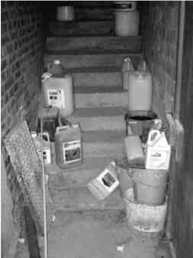
Behälter, die so abgestellt sind, behindern das Begehen der Treppe, so dass schwere Sturzunfälle die Folge sind und gefährden ihre Kinder.

- Tragen Sie dabei die vorgeschriebene Schutzkleidung.