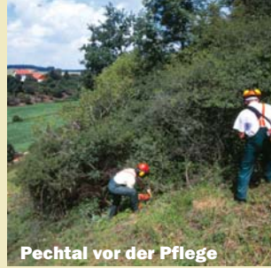
Pechtal vor der Pflege

Heute werden diese Flächen oft nicht mehr beweidet und drohen durch Verbuschung ganz zu verschwinden.