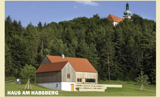
HAUS AM HABSBERG

Wir laden Sie ein, Ihre Heimat neugierig zu betrachten, sich bei uns zu informieren und mitzudiskutieren!