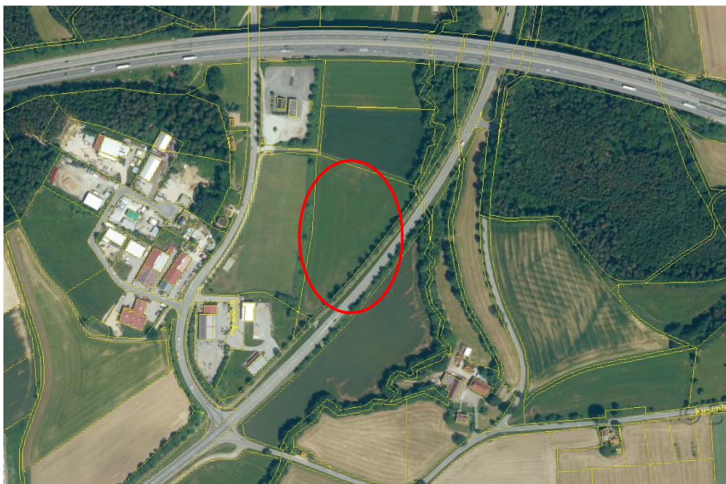
Abb.: Luftbild des Geltungsbereiches

Im Westen befindet sich ein nur gelegentlich wasserführender Graben am Rand des bestehenden Sportgeländes. Das Landschaftsbild ist im gegenständlichen Bereich erheblich durch die nahe Autobahnbrücke und die bestehenden Sportanlagen vorbelastet.